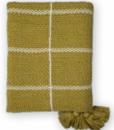
Sandy 129 lime 130×170 cm · 51.2×66.9 in 100% CO