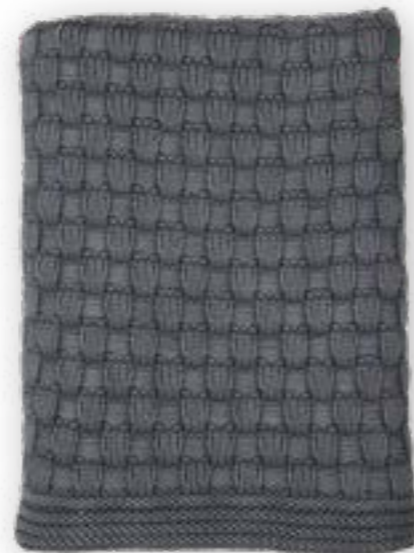
Dandy 170 graphite 130x170 cm · 51,2x66,9 in 100% CO