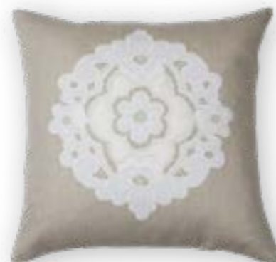
Josefa 110 50x50 cm · 19.7x19.7 in 100% LI