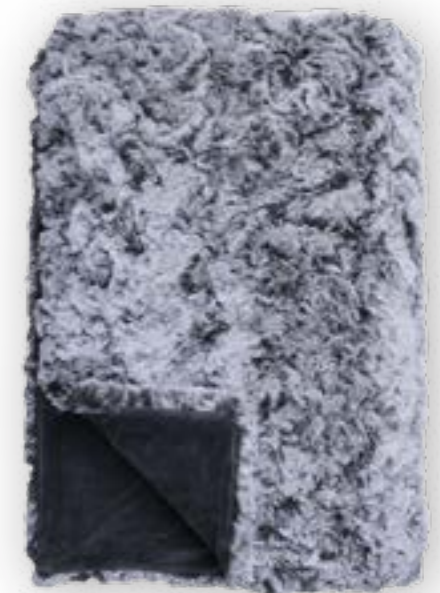
Vivace 170 anthracite 140x190 cm · 55.1x74.8 in Fell | Fur: 100% PES Rückseite | Reverse: 100% PES (Velboa)