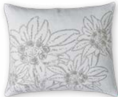
Bergsommer 110 60×50 cm · 23,6×19,7 in 100 % LI

Collection MOUNTAIN DELUXE ALPENGLOW Kissenhüllen | Cushion covers