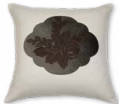
Almrausch 130 50x50 cm · 19.7x19.7 in Vorderseite | Front: 100% CO Rückseite | Reverse: 100% CO Applikation | Appliqué: 40% CV | 35% CO | 25% PES

Collection MOUNTAIN DELUXE ALPINE CHIC Kissenhüllen | Cushion covers