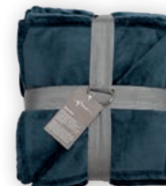
Soft Velvet 185 denim 140x200 cm · 55.1x78.7 in 100% PES