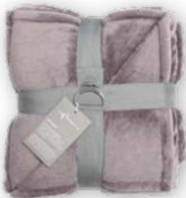
Soft Velvet 183 mauve 140x200 cm · 55.1x78.7 in 100 % PES