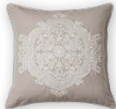
Franzi 111 50x50 cm · 19.7x19.7 in 53% CO | 47% LI