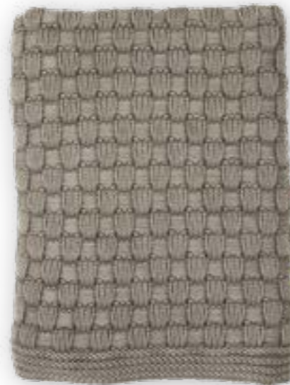
Dandy 140 taupe 130x170 cm · 51,2x66,9 in 100% CO