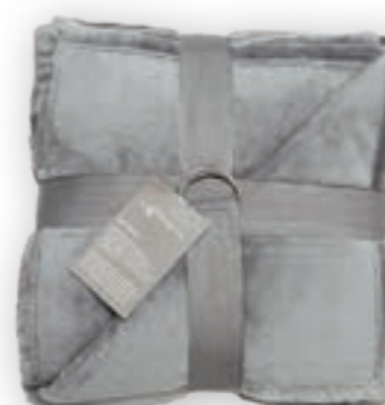
Soft Velvet 142 Stone 140x200 cm · 55.1x78.7 in 100% PES