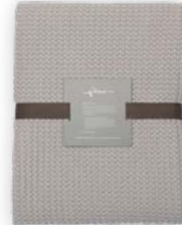
Aviva 111 beige 140×260 cm · 55,1×102,4 in 100 % CO