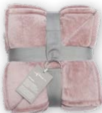
Soft Velvet 152 rosé 140x200 cm · 55.1x78.7 in 100 % PES