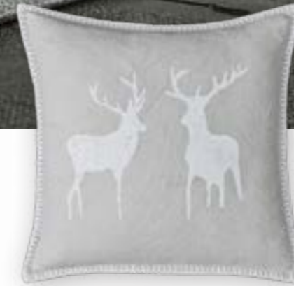
Naturliebe 111 60×60 cm · 23,6×23,6 in 100 % LI Stickgarn | Embroid. yarn: 100 % PES