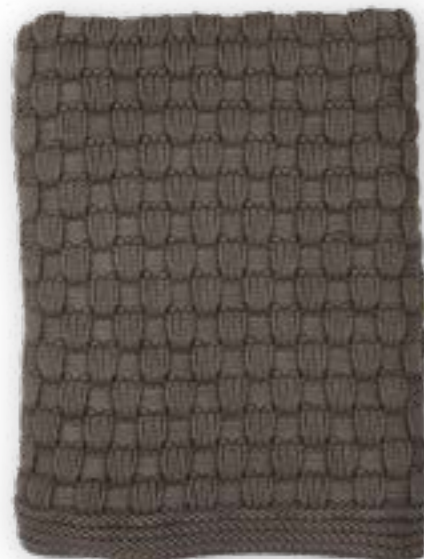
Dandy 141 brown 130x170 cm · 51,2x66,9 in 100% CO