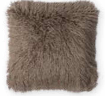
Tibet 141 sand 45 x 45 cm · 17.7 x 17.7 in 83 % PAN | 17 % PES