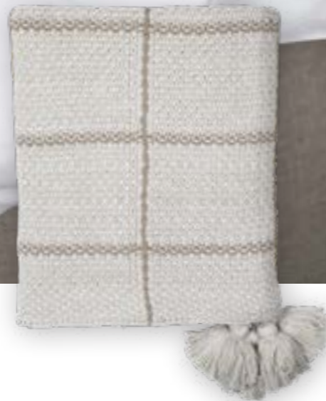
Sandy 119 beige 130×170 cm · 51.2×66.9 in 100% CO

Strickdecke SANDY kombiniert das klassische Patentmuster mit einem eingestrickten Überkaro in einer Kontrastfarbe und trägt an jeder Ecke eine spielerische Quaste. Erhältlich in fünf Farbstellungen.