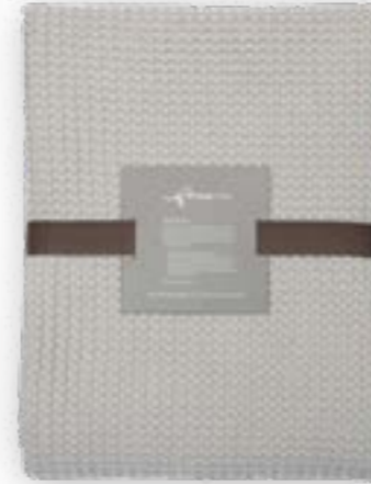
Aviva 110 linen 140×260 cm · 55,1×102,4 in 100 % CO