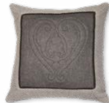
Liebling 140 50x50 cm · 19.7x19.7 in Vorderseite | Front: 46% WO | 41% PES | 9% PAN | 4% PA Rückseite | Reverse: 42% PES | 40% WO | 14% PAN | 4% PA Futter | Lining: 100% CO Borte | Braid: 100% CV

Berge, Edelweiß, Herz und Hirsch! Alte, wohlbekannte Symbole, zeitgemäß interpretiert und in aufwändiger Detailarbeit umgesetzt auf den Kissen von MOUNTAIN DELUXE ALPINE CHIC.