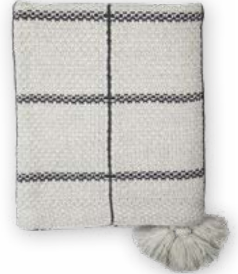
Sandy 179 graphite 130×170 cm · 51.2×66.9 in 100% CO