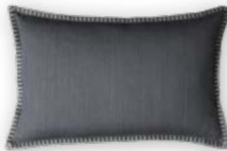
Modern Country 141 stone 60x40 cm · 23.6x15.7 in 100 % LI Stickgarn | Embroid. yarn: 100 % PES