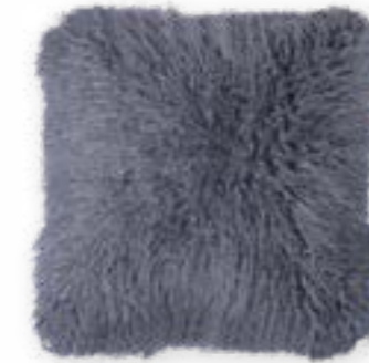
Tibet 180 smokey blue 45 x 45 cm · 17.7 x 17.7 in 83 % PAN | 17 % PES