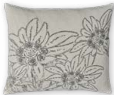
Bergsommer 170 60×50 cm · 23,6×19,7 in 100 % LI