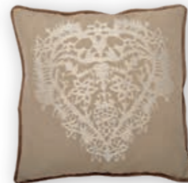
Dolomit 149 50x50 cm · 19.7x19.7 in 60% LI | 40% CO

Detailed and elaborate cushions featuring Alpine motifs in different materials.