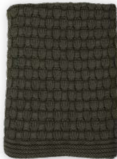
Dandy 130 forest 130x170 cm · 51,2x66,9 in 100% CO