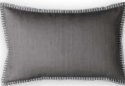
Modern Country 140 taupe grey 60x40 cm · 23.6x15.7 in 100 % LI Stickgarn | Embroid. yarn: 100 % PES