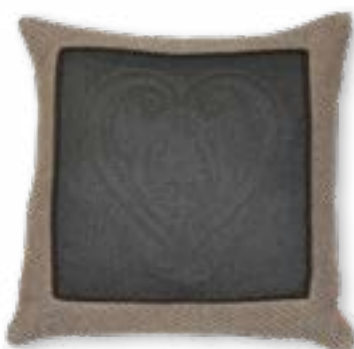
Liebling 130 50x50 cm · 19.7x19.7 in Vorderseite | Front: 46% WO | 41% PES | 9% PAN | 4% PA Rückseite | Reverse: 42% PES | 40% WO | 14% PAN | 4% PA Futter | Lining: 100% CO Borte | Braid: 100% CV