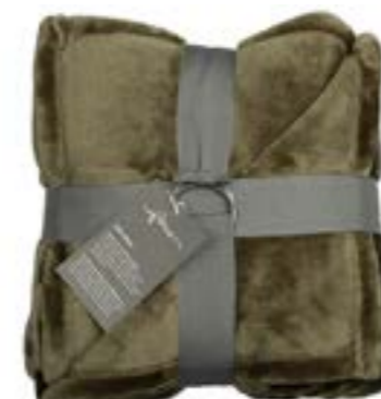
Soft Velvet 134 khaki 140x200 cm · 55.1x78.7 in 100% PES