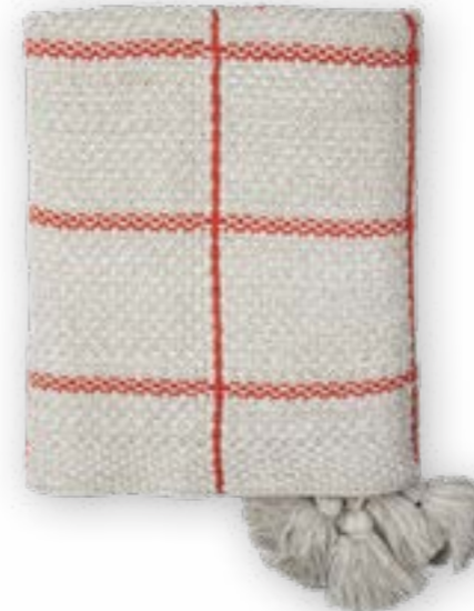
Sandy 169 chili 130×170 cm · 51.2×66.9 in 100% CO