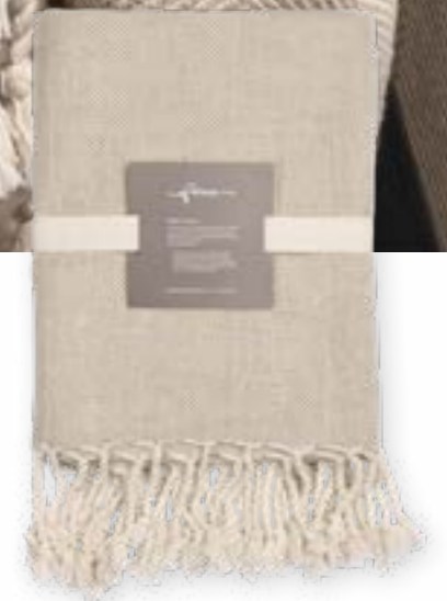
Gianna 110 linen 130x170 cm · 51,2x66,9 in 55 % LI | 45 % CO