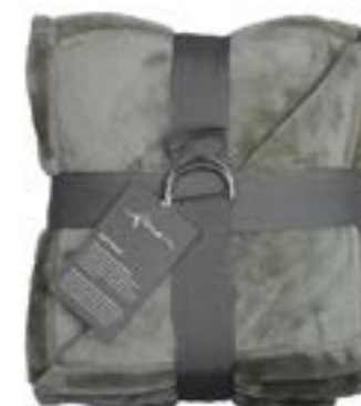
Soft Velvet 133 cottage green 140x200 cm · 55.1x78.7 in 100% PES