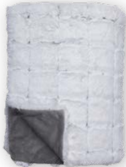
Quadro 110 white

When a clean window pane check meets a natural fur look, when geometry creates order and a long pile blurs it. When cosiness and design form a symbiosis.