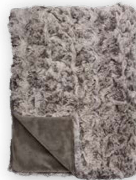
Vivace 140 brown 140x190 cm · 55.1x74.8 in Fell | Fur: 100% PES Rückseite | Reverse: 100% PES (Velboa)

A different view on faux fur! Young, bold and a little wild. With a beautiful pile, a super soft touch and in a swirled, spotted look. That's how cool faux fur can be.