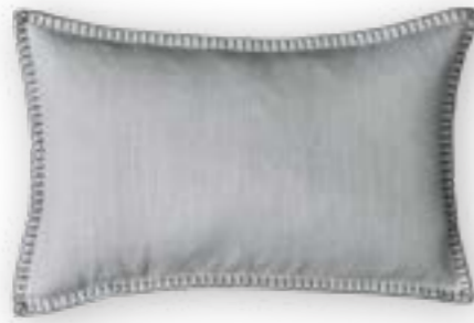
Modern Country 170 light grey 60x40 cm · 23.6x15.7 in 100 % LI Stickgarn | Embroid. yarn: 100 % PES