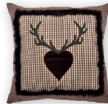
Alpenherz 159 50x50 cm · 19.7x19.7 in 100% CO