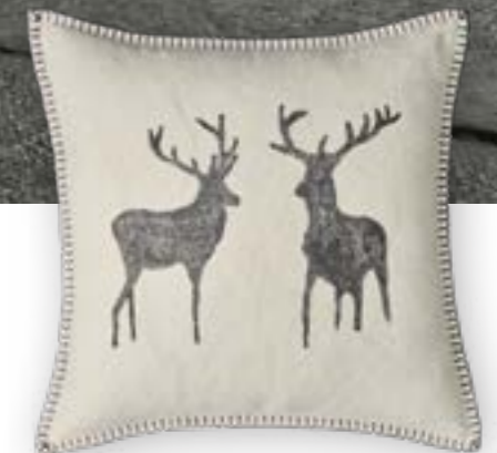
Naturliebe 112 60×60 cm · 23,6×23,6 in 100 % LI Stickgarn | Embroid. yarn: 100 % PES