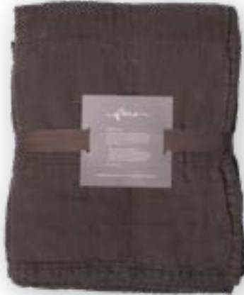
Yara 141 brown 140x260 cm · 55,1x102,4 in 100 % LI Füllung | Filling: 100 % PES