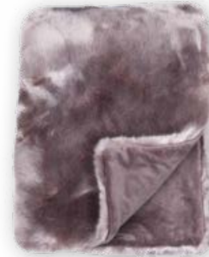
Luxe 151 rosewood 140x190 cm · 55.1x74.8 in Fell | Fur: 90 % PAN | 10 % PES Rückseite | Reverse: 100 % PES Rückseite | Reverse: 100 % PES (Velboa)