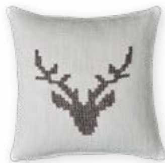
Chalet 111 45×45 cm · 17,7×17,7 in 45 % LI | 40 % CV | 15 % CO Stickgarn | Embroid. yarn: 100 % PAN