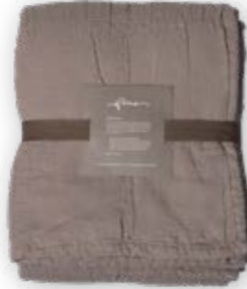
Yara 140 taupe 140x260 cm · 55,1x102,4 in 100 % LI Füllung | Filling: 100 % PES