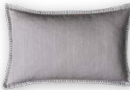
Modern Country 150 rose dust 60x40 cm · 23.6x15.7 in 100 % LI Stickgarn | Embroid. yarn: 100 % PES