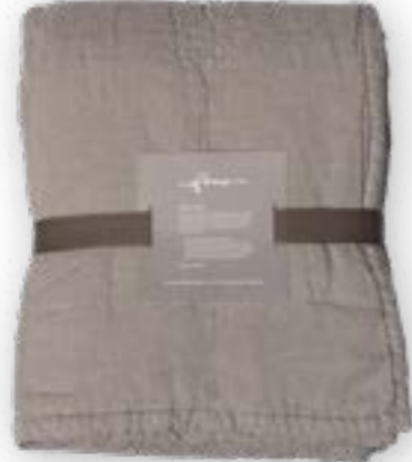
Yara 172 stone 140x260 cm · 55,1x102,4 in 100 % LI Füllung | Filling: 100 % PES