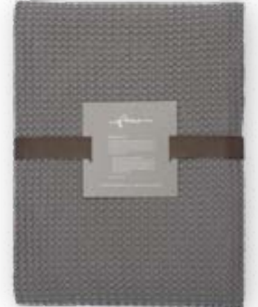
Aviva 170 grey 140×260 cm · 55,1×102,4 in 100 % CO