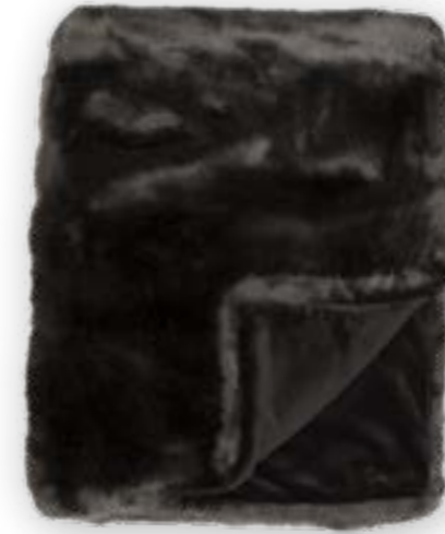
Luxe 140 mocca 140x190 cm · 55.1x74.8 in Fell | Fur: 90 % PAN | 10 % PES Rückseite | Reverse: 100 % PES Rückseite | Reverse: 100 % PES (Velboa)