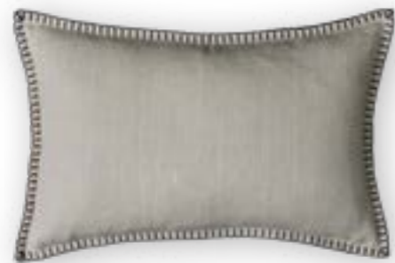
Modern Country 111 beige 60x40 cm · 23.6x15.7 in 100 % LI Stickgarn | Embroid. yarn: 100 % PES