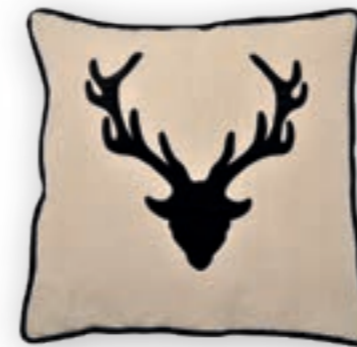
Geierwally 149 50x50 cm · 19.7x19.7 in 60% LI | 40% CO

Collection MOUNTAIN DELUXE Kissenhüllen | Cushion covers