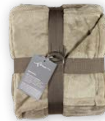
Soft Velvet 111 beige 140x200 cm · 55.1x78.7 in 100% PES