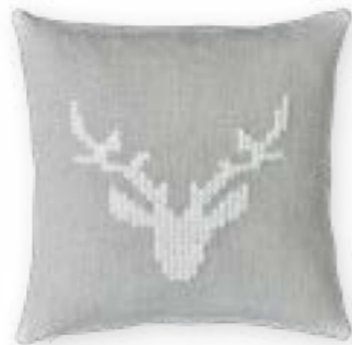
Chalet 170 45×45 cm · 17,7×17,7 in 45 % LI | 40 % CV | 15 % CO Stickgarn | Embroid. yarn: 100 % PAN

Unsere ALPENGLOW-Kissen zeigen zeitgemäße Variationen des MOUNTAIN DELUXE-Themas: Hirsch und Edelweiß stehen im Mittelpunkt, wieder neu, wieder anders. Sie kommen als stilisierter Motivdruck auf feinem Leinen oder als handwerklich anmutende Kreuzstichstickerei. Zurückhaltend gibt sich ein schlichtes Leinenkissen mit Ziersticheinfassung.