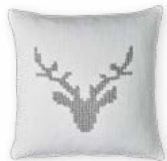
Chalet 110 45×45 cm · 17,7×17,7 in 45 % LI | 40 % CV | 15 % CO Stickgarn | Embroid. yarn: 100 % PAN