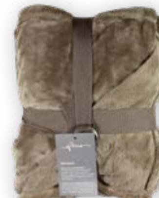
Soft Velvet 112 taupe 140x200 cm · 55.1x78.7 in 100% PES