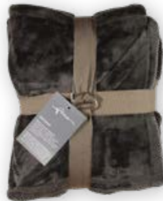
Soft Velvet 171 black 140x200 cm · 55.1x78.7 in 100 % PES