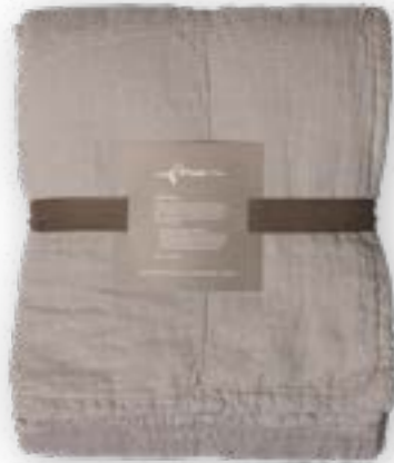
Yara 170 light-grey 140x260 cm · 55,1x102,4 in 100 % LI Füllung | Filling: 100 % PES