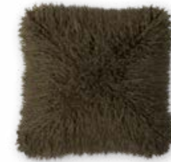
Tibet 130 moss 45 x 45 cm · 17.7 x 17.7 in 83 % PAN | 17 % PES