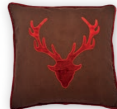
Geierwally 159 50x50 cm · 19.7x19.7 in 60% LI | 40% CO

Detailreich gestaltete und aufwändig verarbeitete Kissen mit alpinen Motiven in unterschiedlichen Materialien.