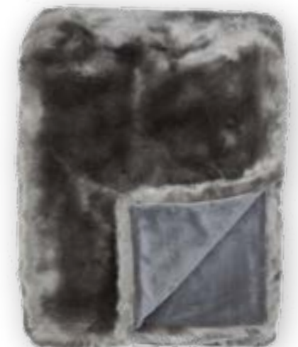
Luxe 141 taupe 140x190 cm · 55.1x74.8 in Fell | Fur: 90 % PAN | 10 % PES Rückseite | Reverse: 100 % PES Rückseite | Reverse: 100 % PES (Velboa)