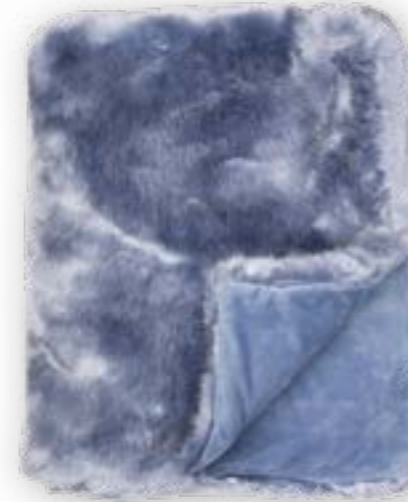
Luxe 181 arctic 140x190 cm · 55.1x74.8 in Fell | Fur: 90 % PAN | 10 % PES Rückseite | Reverse: 100 % PES Rückseite | Reverse: 100 % PES (Velboa)