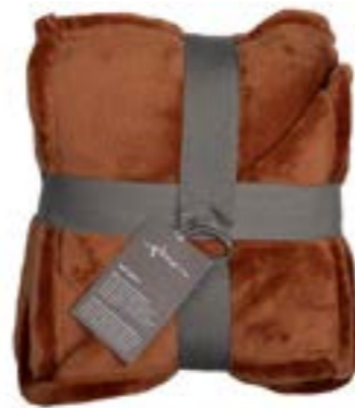
Soft Velvet 161 terracotta 140x200 cm · 55.1x78.7 in 100 % PES