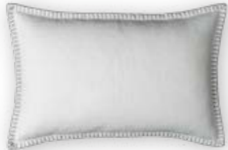
Modern Country 110 offwhite 60x40 cm · 23.6x15.7 in 100 % LI Stickgarn | Embroid. yarn: 100 % PES

Collection MOUNTAIN DELUXE ALPENGLOW Kissenhüllen | Cushion covers