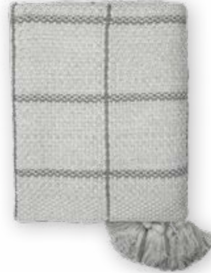
Sandy 139 jade 130×170 cm · 51.2×66.9 in 100% CO

The SANDY knitted throw comes in the classic patent pattern with a nonchalant knitted over check in a contrasting colour. And on top of that on every corner with a playful tassel. Available in five colour shades.