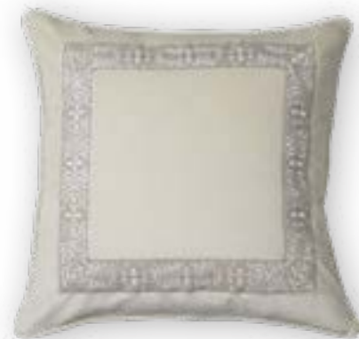
Zita 110 50x50 cm · 19.7x19.7 in 100% CO

Back home at last – with these cushions: deer, hearts, large decorative features and neutral colours plus a touch of rustic elegance, finished in high-quality natural materials.