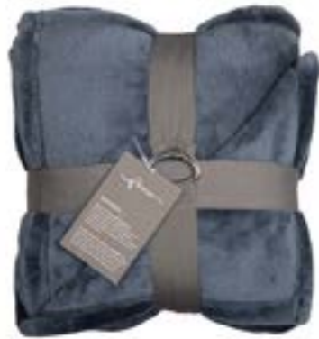
Soft Velvet 186 petrol 140x200 cm · 55.1x78.7 in 100 % PES