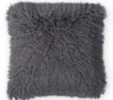
Tibet 170 slate 45 x 45 cm · 17.7 x 17.7 in 83 % PAN | 17 % PES