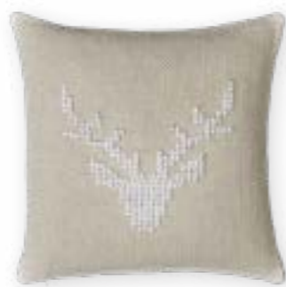
Chalet 112 45×45 cm · 17,7×17,7 in 45 % LI | 40 % CV | 15 % CO Stickgarn | Embroid. yarn: 100 % PAN