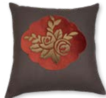
Almrausch 160 50x50 cm · 19.7x19.7 in Vorderseite | Front: 100% PES Rückseite | Reverse: 100% CO Applikation | Appliqué: 40% CV | 35% CO | 25% PES