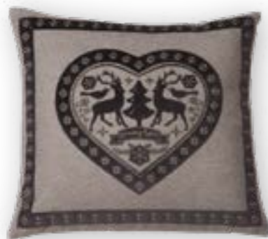
Hirschlein 140 50x45 cm · 19.7x17.7 in 42% WO | 35% PES | 20% PAN | 3% PA