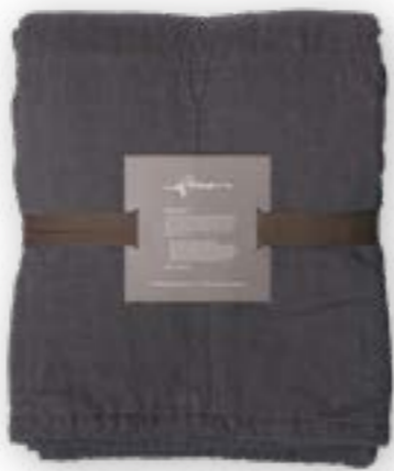
Yara 171 anthracite 140x260 cm · 55,1x102,4 in 100 % LI Füllung | Filling: 100 % PES