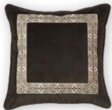
Zita 140 50x50 cm · 19.7x19.7 in 100% CO