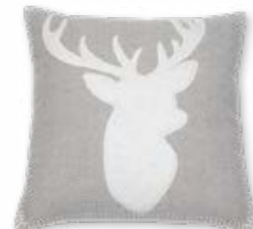
Weidmann 170 45x45 cm · 17.7x17.7 in Vorderseite | Front: 52% PES | 35% WO | 10% PAN | 3% PA Rückseite | Reverse: 100% CO Applikation | Appliqué: 42% PES | 40% WO | 14% PAN | 4% PA