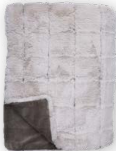
Quadro 141 taupe

140×190 cm · 55.1×74.8 in Fell | Fur: 100% PES Rückseite | Reverse: 100% PES (Velboa)