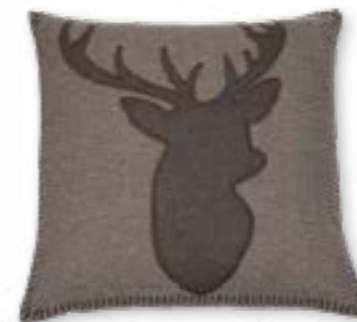
Weidmann 140 45x45 cm · 17.7x17.7 in Vorderseite | Front: 52% PES | 35% WO | 10% PAN | 3% PA Rückseite | Reverse: 100% CO Applikation | Appliqué: 42% PES | 40% WO | 14% PAN | 4% PA

Mountains, edelweiss, hearts and deer! The MOUNTAIN DELUXE ALPINE CHIC cushions feature old, well-known symbols reinterpreted for the modern day and worked in elaborate detail.