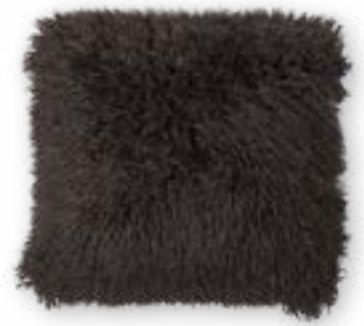
Tibet 140 ebony 45 x 45 cm · 17.7 x 17.7 in 83 % PAN | 17 % PES