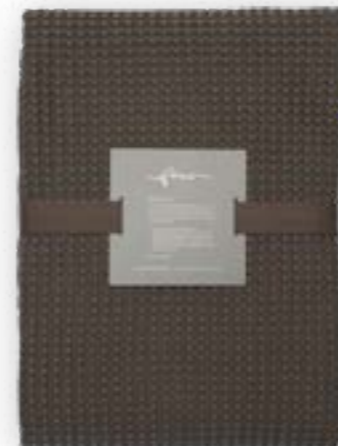
Aviva 140 brown 140×260 cm · 55,1×102,4 in 100 % CO