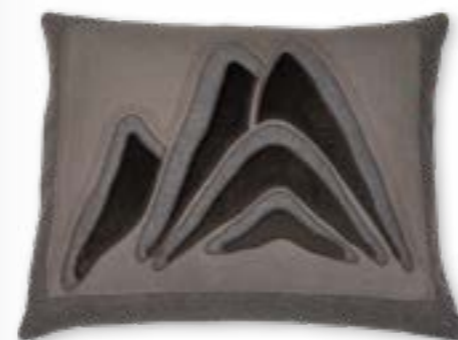
Serles 140 60x50 cm · 23.6x19.7 in Vorderseite | Front: 55% CV | 27% LI | 10% WO | 6% PES | 1% PA | 1% PAN Rückseite | Reverse: 67% CV | 33% LI Applikation | Appliqué: 28% WO | 27% CV | 24% CO | 18% PES | 2% PAN | 1% PA