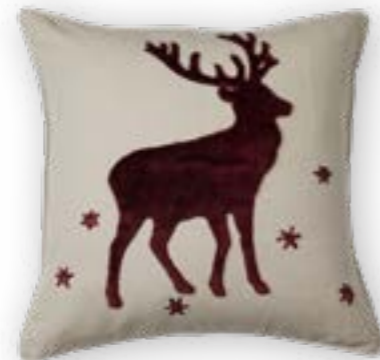
Platzhirsch 150 50x50 cm · 19.7x19.7 in 53% CO | 47% LI

Endlich zuhause! – mit diesen Kissen: Hirsche, Herzen, großflächige, dekorative Elemente und neutrale Farben mit einem Hauch ländlicher Eleganz, umgesetzt in hochwertigen natürlichen Materialien.