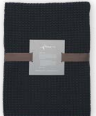
Aviva 171 graphite 140×260 cm · 55,1×102,4 in 100 % CO