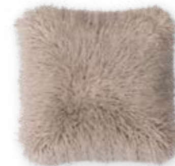
Tibet 111 cashmere 45 x 45 cm · 17.7 x 17.7 in 83 % PAN | 17 % PES