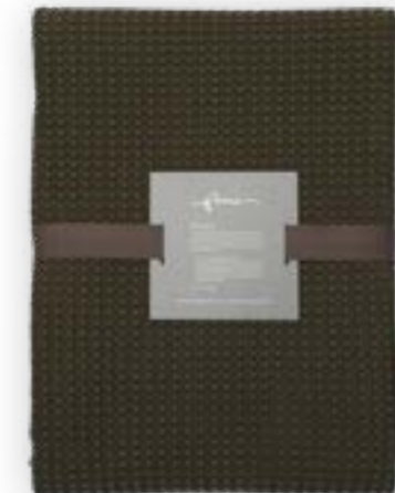
Aviva 130 forest 140×260 cm · 55,1×102,4 in 100 % CO