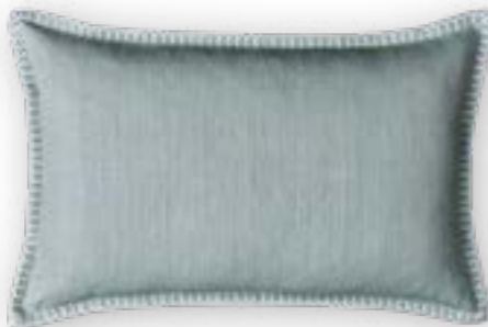
Modern Country 130 mint 60x40 cm · 23.6x15.7 in 100 % LI Stickgarn | Embroid. yarn: 100 % PES