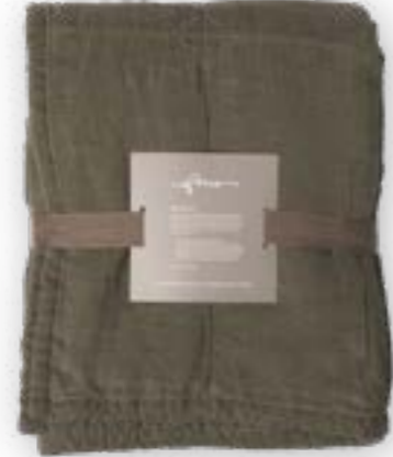
Yara 130 forest 140x260 cm · 55,1x102,4 in 100 % LI Füllung | Filling: 100 % PES