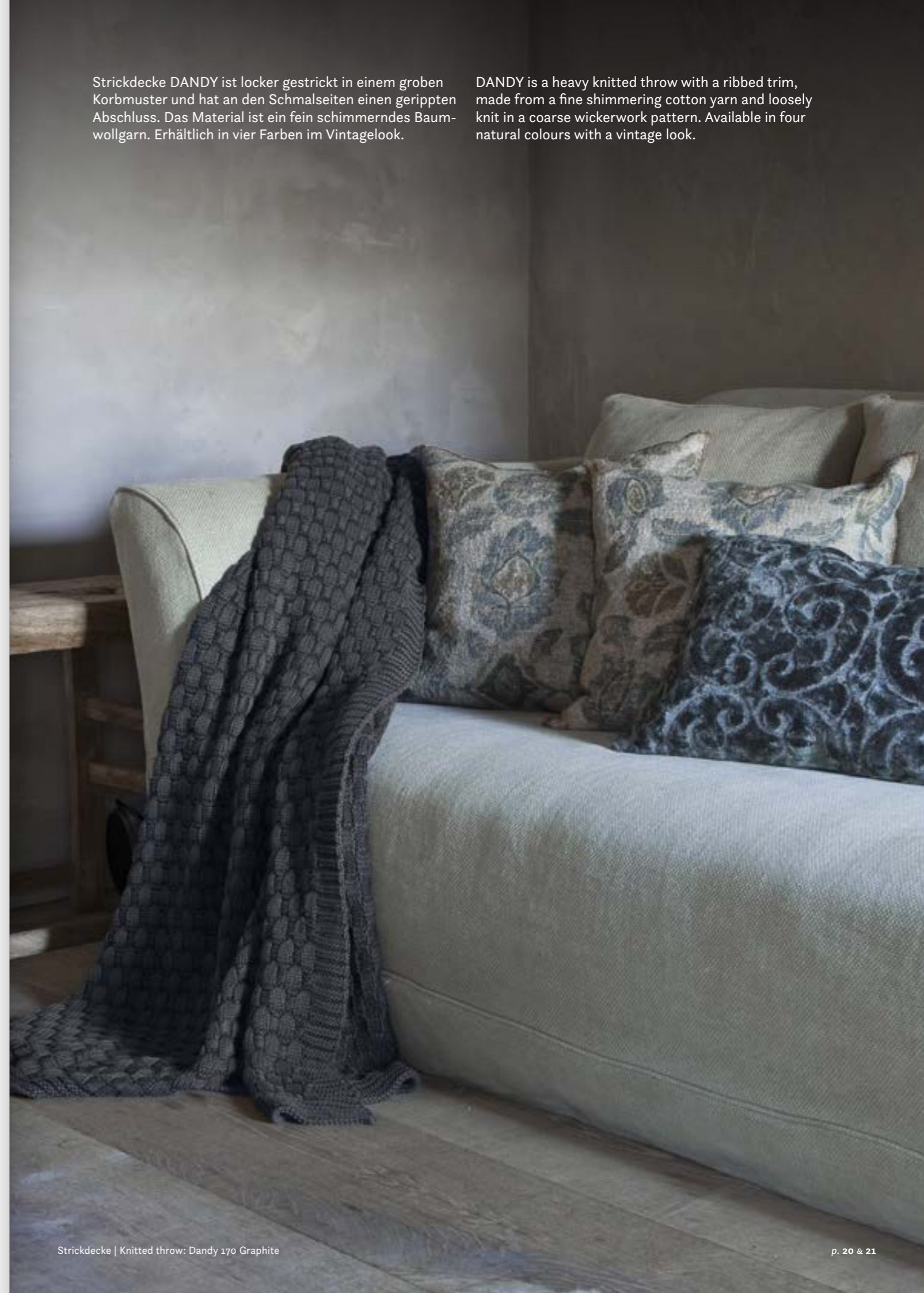
Strickdecke | Knitted throw: Dandy 170 Graphite

DANDY is a heavy knitted throw with a ribbed trim, made from a fine shimmering cotton yarn and loosely knit in a coarse wickerwork pattern. Available in four natural colours with a vintage look.