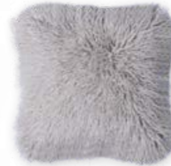
Tibet 171 silver 45 x 45 cm · 17.7 x 17.7 in 83 % PAN | 17 % PES