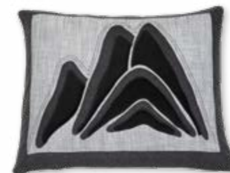
Serles 170 60x50 cm · 23.6x19.7 in Vorderseite | Front: 55% CV | 27% LI | 10% WO | 6% PES | 1% PA | 1% PAN Rückseite | Reverse: 67% CV | 33% LI Applikation | Appliqué: 28% WO | 27% CV | 24% CO | 18% PES | 2% PAN | 1% PA