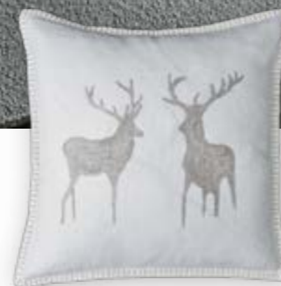
Naturliebe 110 60×60 cm · 23,6×23,6 in 100 % LI Stickgarn | Embroid. yarn: 100 % PES