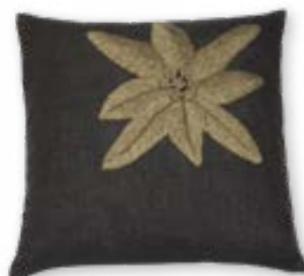
Alpenglühn 130 45x45 cm · 17.7x17.7 in Vorderseite | Front: 100% LI Rückseite | Reverse: 100% CO Stickgarn | Embroid. yarn: 100% PAN