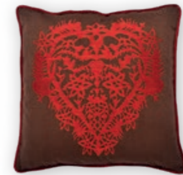
Dolomit 159 50x50 cm · 19.7x19.7 in 60% LI | 40% CO