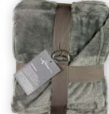
Soft Velvet 170 grey 140x200 cm · 55.1x78.7 in 100% PES