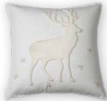
Platzhirsch 110 50x50 cm · 19.7x19.7 in 53% CO | 47% LI

Collection MOUNTAIN DELUXE WELCOME HOME Kissenhüllen | Cushion covers