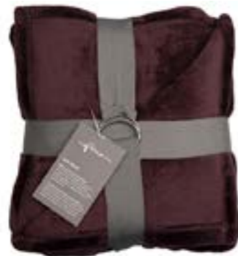
Soft Velvet 153 bordeaux 140x200 cm · 55.1x78.7 in 100 % PES