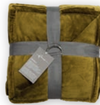
Soft Velvet 120 curry 140x200 cm · 55.1x78.7 in 100% PES