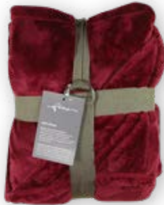
Soft Velvet 150 red 140x200 cm · 55.1x78.7 in 100 % PES