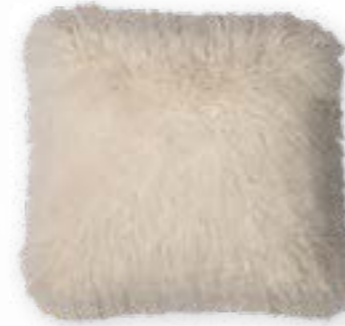
Tibet 110 ivory 45 x 45 cm · 17.7 x 17.7 in 83 % PAN | 17 % PES