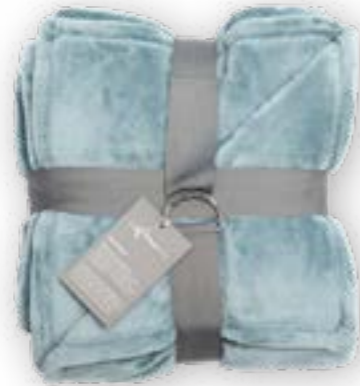
Soft Velvet 184 paleblue 140x200 cm · 55.1x78.7 in 100 % PES