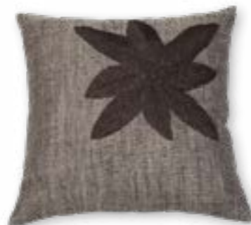
Alpenglühn 140 45x45 cm · 17.7x17.7 in Vorderseite | Front: 100% LI Rückseite | Reverse: 100% CO Stickgarn | Embroid. yarn: 100% PAN