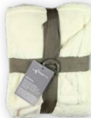
Soft Velvet 110 off-white 140x200 cm · 55.1x78.7 in 100% PES

High pile velour throw made from high quality fibres and available in many colours including lots of natural tones, some stronger and a few muted colours. Washable.