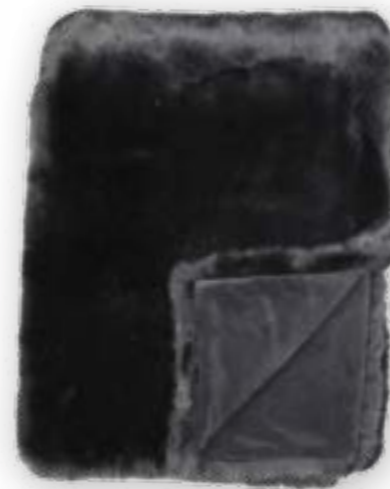
Luxe 171 graphit 140x190 cm · 55.1x74.8 in Fell | Fur: 90 % PAN | 10 % PES Rückseite | Reverse: 100 % PES Rückseite | Reverse: 100 % PES (Velboa)